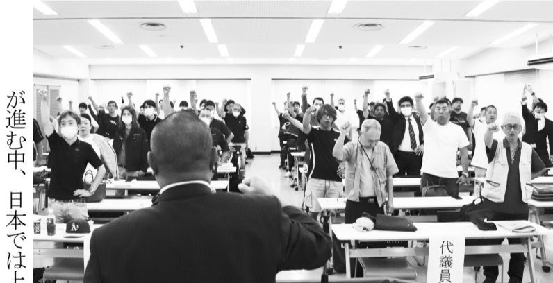
全港湾関西地方の飛躍へ団結ガンバロー

伊ドライン、2024年問題等についての幅広い意見が出されました。質疑討論が出し尽くされたのち、執行部より提案された第1号議案から第6号議案まですべて全体の拍手で採択されました。