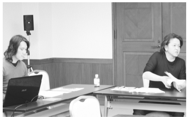
2020年 部内講師を立てて反戦学習会

労基法等の問題は執行部でも難しいと思えるものをあえて出し、積極的に意見交換することでお互いの理解度を深めています。